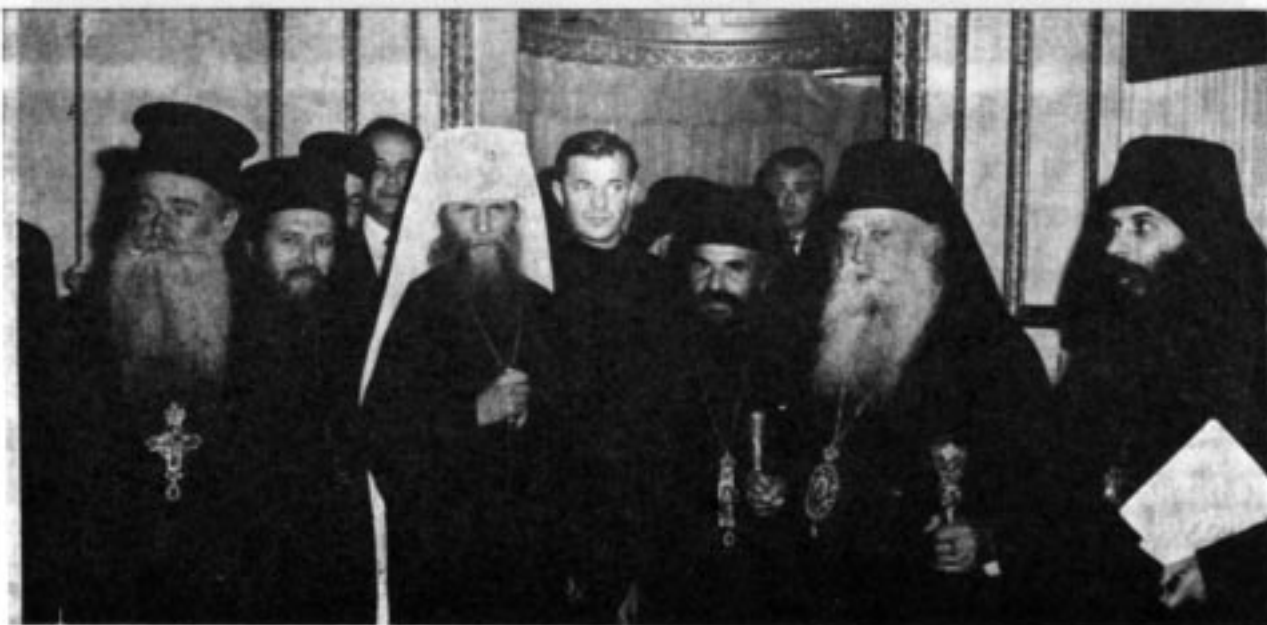
Владыка Митрополитъ съ Греческимъ Духовенствомъ.

Твердая принципиальная позиція Русской Зарубежной Церкви, ее стояніе за чистое немодернизированное Православіе не только спасаетъ Православіе въ Россіи, не только спасаетъ души русскихъ православныхъ эмигрантовъ, но становится нѣкимъ моральнымъ центромъ, опорой для наиболѣе стойкихъ православныхъ, не принадлежавшихъ ранѣе къ Русской Православной Церкви во всемъ свободномъ мірѣ.