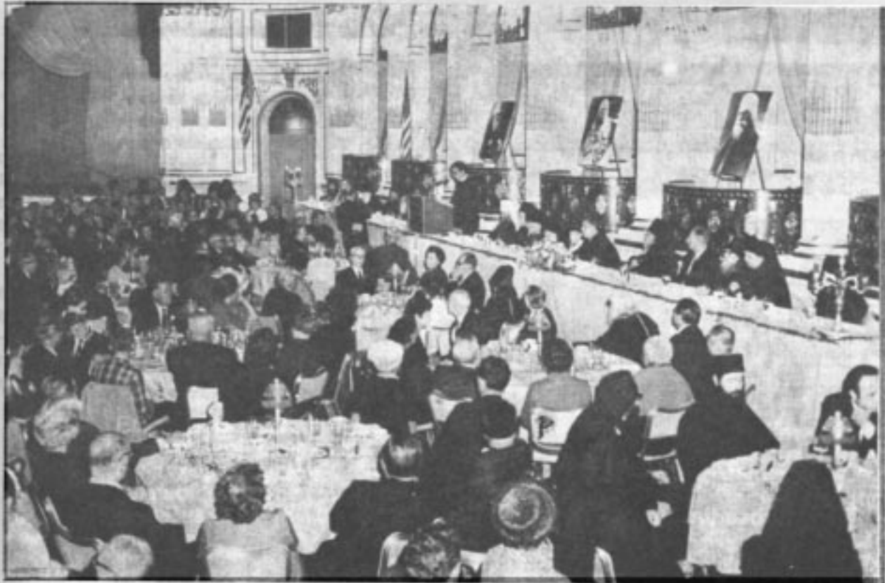
Общій видъ зала.

Вице-предсѣдатель Организационнаго Комитета, А. П. Фекула, огласилъ рядъ привѣтственныхъ телеграммъ отъ русскихъ организацій и официальныхъ правительственныхъ лицъ, среди которыхъ отмѣтилъ телеграмму отъ губернатора штата Нью-Йорка г. Нельсонъ Рокфеллера и отъ сенатора Джеймса Баклей.