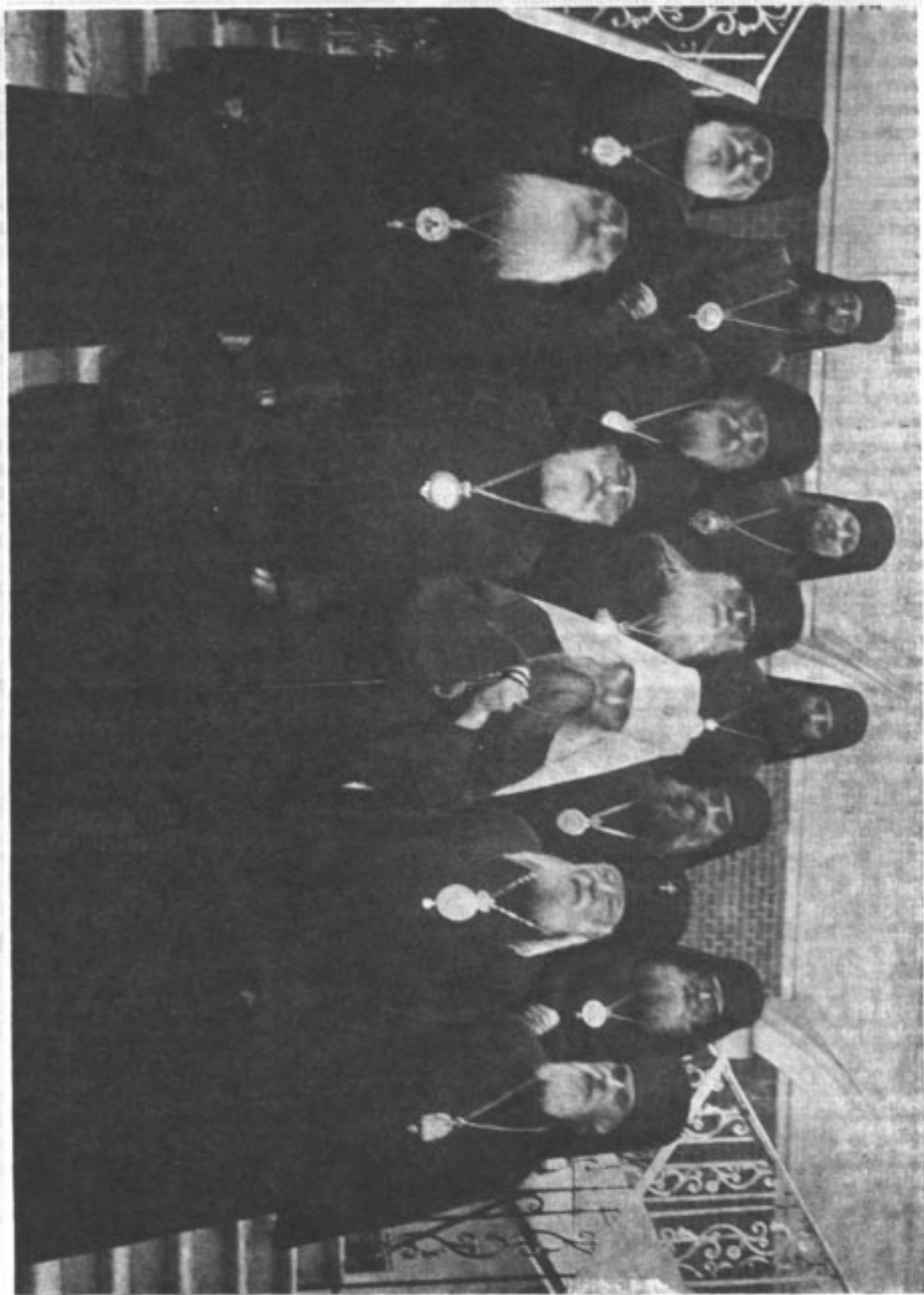
Архиепiскопъ Годора 1871 г. несутъ епитимью въ Синодальную палату въ г. Ново-Иерусалимъ.