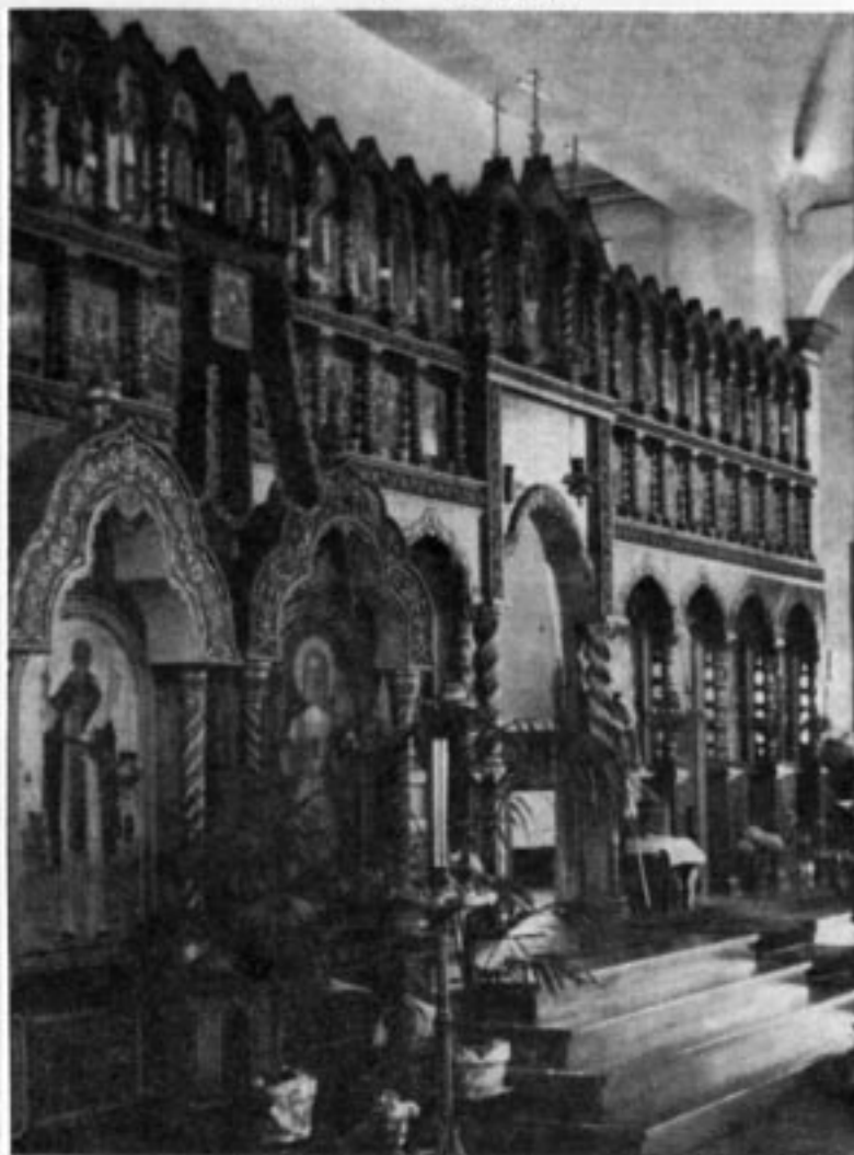
Свято-Николаевскій Кафедральный Соборъ въ Монреалѣ

вать помощь, которая будетъ слагаться изъ этихъ маленькихъ регулярныхъ лептъ, для созданія церковно-культурнаго центра. Вотъ въ этомъ и заключается наше къ вамъ конкретное обращеніе. Въ скоромъ времени вы получите отъ насъ воззванія и мы просимъ васъ откликнуться на нихъ и вы увидите тогда, какъ эти пожертвованія, которыя вы будете давать, къ вамъ же будутъ возвращаться. Вы будете рады, когда наши Епископы и наши міряне появятся на телевиденіи и будутъ защищать русское имя. Вы услышите православную мысль, православное объясненіе всѣхъ міровыхъ проблемъ. Вы будете довольны и вы тогда охотно дадите еще новую лепту. Потому что русскій народъ — щедрый народъ и онъ хочетъ только благихъ результатовъ. Мы много говорили до сихъ поръ, пора теперь приступить, съ помощью Божіей, и къ дѣлу.